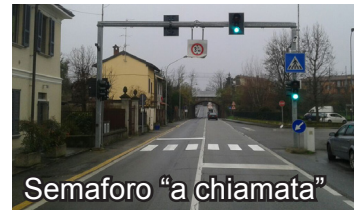
Semaforo "a chiamata"