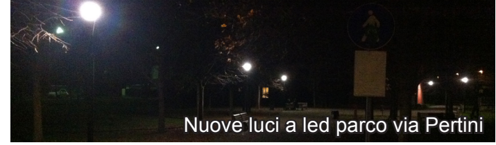
Nuove luci a led parco via Pertini

Viabilità stradale: riparazioni cedimenti fognari; nuova segnaletica orizzontale (via Rossa, Biagi e D'Antona); modifica semaforo via XXVI Aprile con installazione dispositivo di chiamata ad attraversamento pedonale, installazione di "specchi" in punti a scarsa visibilità, sostituzione e posa nuova segnaletica verticale, nuovi paracarri in via Casone Burroni.