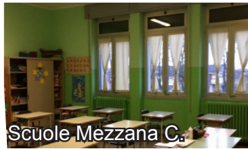
Scuole Mezzana C.

Centro polifunzionale Mezzana C.: ritinteggiatura locale polivalente; lavori di manutenzione ordinaria.