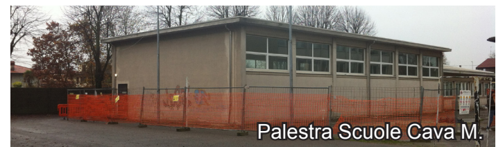
Palestra Scuole Cava M.